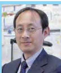
長崎大学 熱帯医学・グローバルヘルス研究科 橋爪 真弘 教授