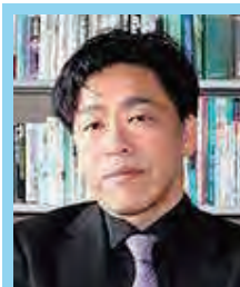
長崎大学 医歯薬学総合研究科 西田 教行 教授